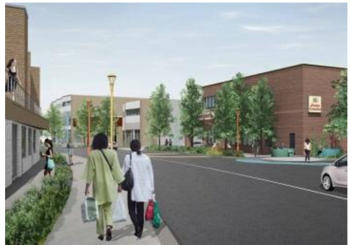
Design urbain du réaménagement du boulevard Gouin Ouest entre le chemin Somerset et la rue de la Miséricorde Illustrations : Firme Civiliti, Février 2016

Le 22 février dernier, la firme CIVILITI présentait publiquement l'étude de design urbain pour le boulevard Gouin Ouest, qu'elle a réalisée dans le cadre du projet « Revitalisons Gouin Ouest! » (action # 3 de l'enjeu Aménagement urbain). L'étude a été très bien reçue, notamment par les autorités municipales. Elle propose deux