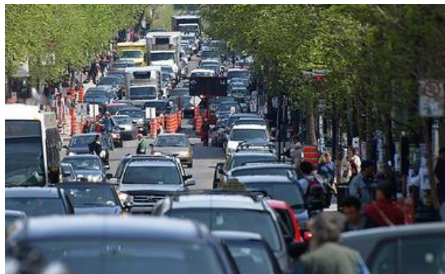
Circulation difficile sur une avenue montréalaise

Les actions # 5 (intervenir pour l'amélioration du transport collectif et actif) et # 6 (travailler à la canalisation de la circulation de transit) de l'enjeu Aménagement urbain, n'ont pas de porteur officiel depuis un bon moment déjà. En effet, le comité de suivi de l'enjeu Aménagement urbain n'avait, jusqu'à maintenant, trouvé aucune solution suite au désistement du Comité citoyen Circulation Cartierville (CCC), qui était à l'origine le responsable de ces deux actions. Toutefois, une piste de solution s'est pointée récemment. Le comité proposerait de réécrire les actions # 5 et # 6, de manière à ce que les activités de représentation et de mobilisation soient prises en charge par le comité de suivi lui-même et que, par ailleurs, les activités reliées davantage à la mise en œuvre soient sous la responsabilité de l'arrondissement et/ou de la Ville centre; ce qui est de toute façon le cas dans les faits. Le comité doit maintenant voir avec la Direction du développement du territoire de l'arrondissement si cette piste de solution est envisageable.