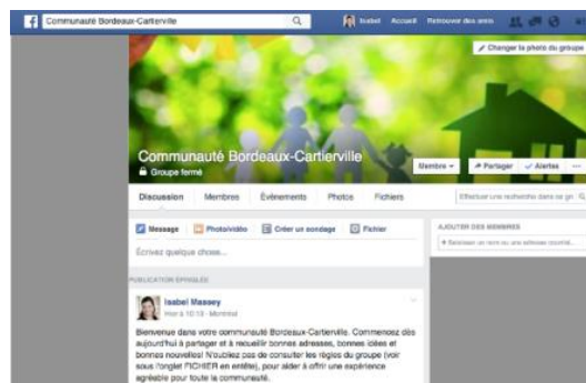
Page Facebook de Communauté Cartierville Capture d'écran : CLIC de Bordeaux-Cartierville, Février 2016

Multipliant les stratégies pour mobiliser les citoyens du quartier, le CLIC a mis sur pied une communauté virtuelle, sous forme de groupe Facebook, intitulé Communauté Bordeaux-Cartierville , en janvier dernier. Et à peine plus d'un mois après sa création, le groupe compte déjà 272 adhérents. Même si c'est le CLIC qui est à l'origine du groupe, l'idée est qu'il soit entièrement pris en charge par les citoyens qui en font partie. Communauté Bordeaux-Cartierville permet aux résidents du quartier d'échanger de l'information, des services, de poser des questions et qui sait, éventuellement, de débattre d'enjeux importants pour notre territoire.