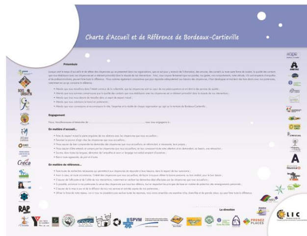
Charte d'Accueil et de Référence de Bordeaux-Cartierville Photo : CLIC de Bordeaux-Cartierville, Septembre 2012

En septembre 2012, le comité de la « Démarche du tout inclus » (maintenant l'action # 2 de l'enjeu Relations interculturelles et inclusion) lançait la « Charte d'accueil et de référence de Bordeaux-Cartierville » ; une première du genre à Montréal. Cette charte, signée par la quasi-totalité des membres du CLIC à l'époque, se voulait un engagement mutuel pris par les organisations locales, visant à accueillir adéquatement les populations dans nos services et à effectuer un travail de référence professionnel. Quatre ans plus tard, le comité souhaite sonder les membres ayant signé la charte, afin de connaître la visibilité et l'impact qu'a eus cet outil au sein de leur organisation. Ce sondage sera suivi, à l'automne 2016, d'une discussion de type « forum ouvert » autour des questions touchant l'accueil et la référence.