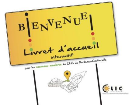
Page de couverture du livret d'Accueil Illustration : CLIC de Bordeaux-Cartierville

Le CLIC lancera début avril un livret d'accueil interactif, dont l'objectif sera de faciliter l'intégration des nouveaux membres. Cet outil virtuel, simple et attrayant, permettra entre autres d'accéder par un simple clic à toute la documentation pertinente pour qui veut découvrir sa Table de quartier.