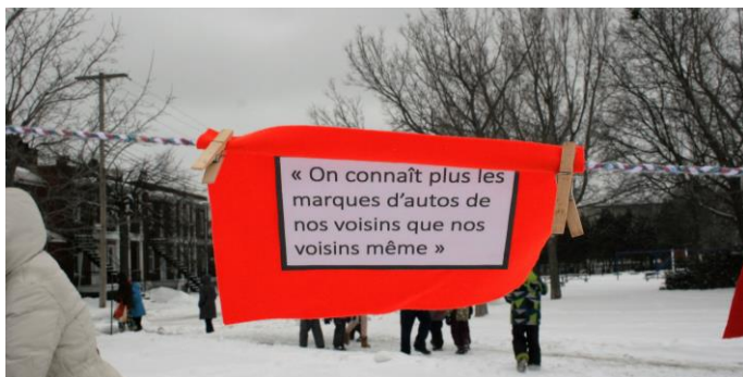
« Salon du dialogue » du CCDI lors de l'évènement « Hiver en fête » Photo : CCDI, 28 février 2016

Dans le cadre de son projet « Le dialogue réchauffe les cœurs à Bordeaux-Cartierville » (action # 3 de l'enjeu Relations interculturelles et inclusion), le CCDI (Comité Citoyen sur le Dialogue Interculturel) de B-C, a tenu un « Salon du dialogue », lors de l'évènement « Hiver en fête », dimanche le 28 février dernier au parc de Méty. Pour l'occasion, les citoyens ont été invités à lire et à réagir à des phrases étendues sur la « Corde à mots », tricotée tout spécialement pour le projet par les Tricoteuses du Centre d'Action Bénévole Bordeaux-Cartierville. Ces phrases ont été recueillies par les membres du CCDI depuis deux mois, auprès des citoyens rencontrés au cours des séances de distribution de chocolat chaud dans les abribus et sur les patinoires du quartier.