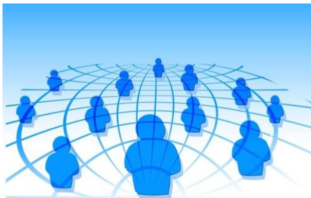
Visuel de l'invitation du déjeuner réseautage

Même si la Table en employabilité d'A-C, responsable de l'enjeu Emploi du plan, n'a pas les ressources actuellement pour organiser tel que prévu un forum sur l'emploi dans B-C (action # 1 de l'enjeu), elle contribuera tout de même à l'atteinte des objectifs du plan via la tenue, le 5 avril prochain au Centre communautaire Ahuntsic, d'un déjeuner réseautage entre les conseillers en emploi et les divers intervenants terrain du territoire. Le but est que ces derniers acquièrent une connaissance plus fine des ressources en emploi qui peuvent soutenir leur clientèle respective.